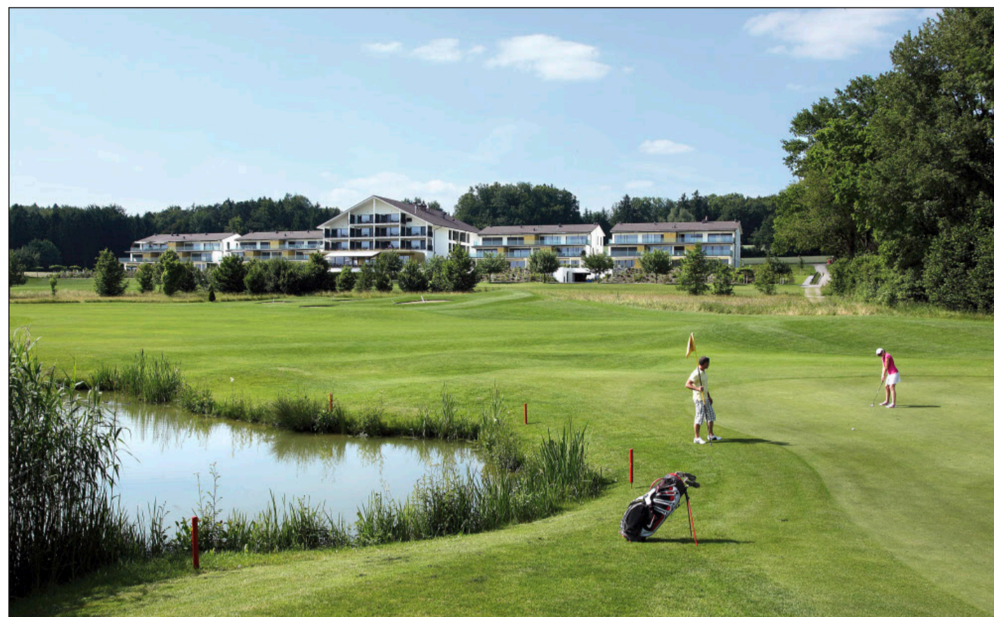
In Lipperswil im Thurgauer Hinterland bildet das neue Wellnesshotel Golfpanorama eine ideale Einheit mit dem 27-Loch-Golfplatz.

lern. Das Grand Resort wie auch der Golfclub Bad Ragaz wurden von Swiss Golf zum Golfhotel of the Year 2009 sowie zum Golfcourse 2009 erkoren. Diese Auszeichnung habe die Anstrengungen, einen top gepflegten Platz zu bieten, bestätigt, aber wetterbedingt nicht deutlich mehr Spieler gebracht, sagt Polligkeit, dessen Turnierkalender